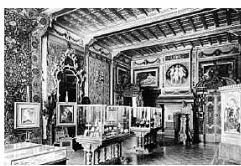
Salone dorato nel 1883.

L'intervento finanziato dal World Monuments Fund che apre la prima sede italiana a Milano