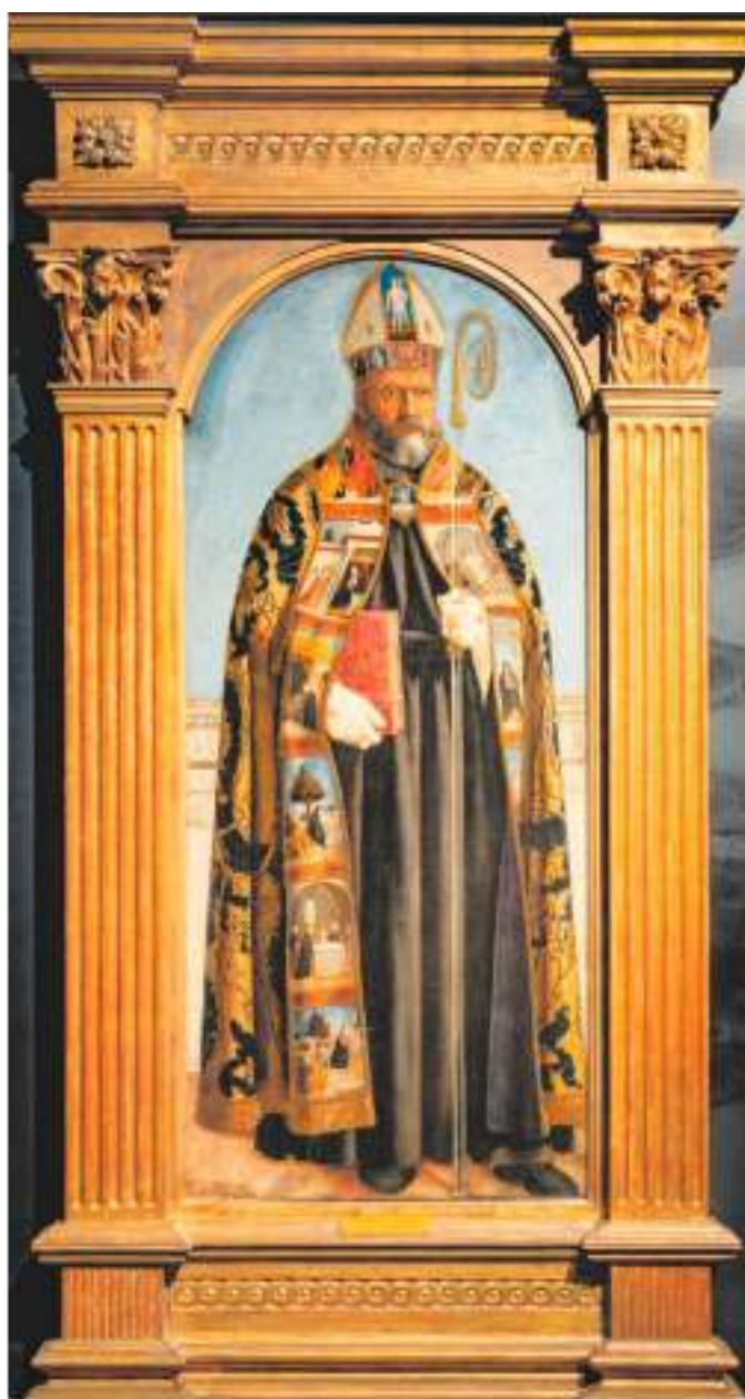
IL PRESTITO Il Sant'Agostino del Museu de Arte Antiga di Lisbona

la Sant'Apollonia dalla National Gallery of Art di Washington. Da oggi e fino al 24 giugno, in una mostra curata da Machtelt Brüggén Israëls e Nathaniel Silver, il polittico si mostra in prospettiva orizzontale (impossibile ricomporlo in altezza), in un allestimento firmato da Italo Rota e dallo studio CRA Carlo Ratti Associati. Nella sala accanto, in un'efficace video-animazione, i risultati della campagna di analisi scientifiche sostenuta da Fondazione Bracco, main sponsor del progetto (650mila