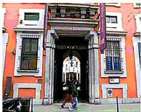
▲ L'ingresso del Poldi Pezzoli

Nei prossimi mesi i cambiamenti al Poldi Pezzoli saranno tanti: partirà un piano di riallestimento di alcune sale, a cominciare dallo scalone di ingresso che avrà una nuova illuminazione, saranno sostituite le didascalie con l'aggiunta di un qr code che rimanderà a nuovi contenuti online, verrà ridisegnato il sito che dal prossimo autunno offrirà ai visitatori anche un ricco palinsesto di podcast sulla storia della casa museo istituita